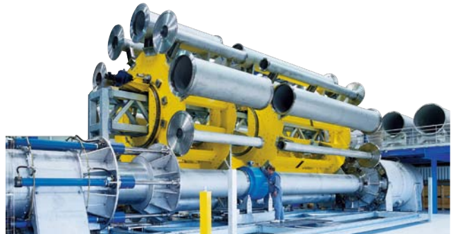
Höchste Genauigkeit bei Laborkalibrierung